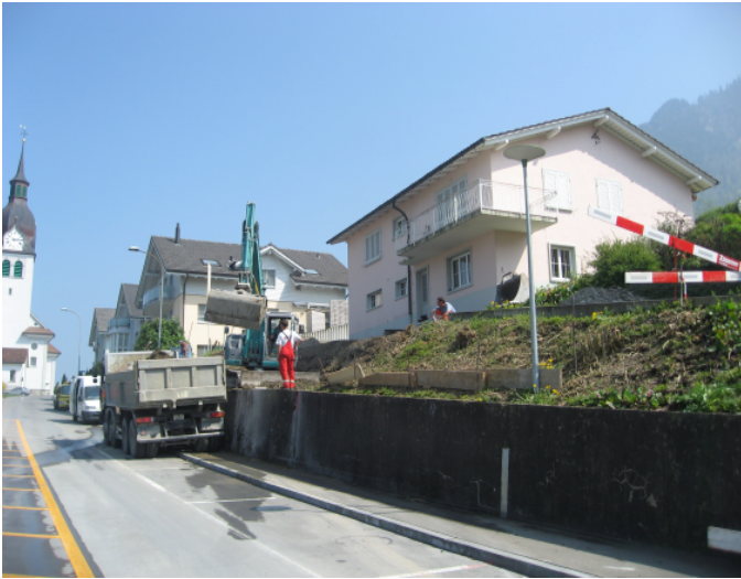
Abbruch Einfamilienhaus, Baujahr 1957