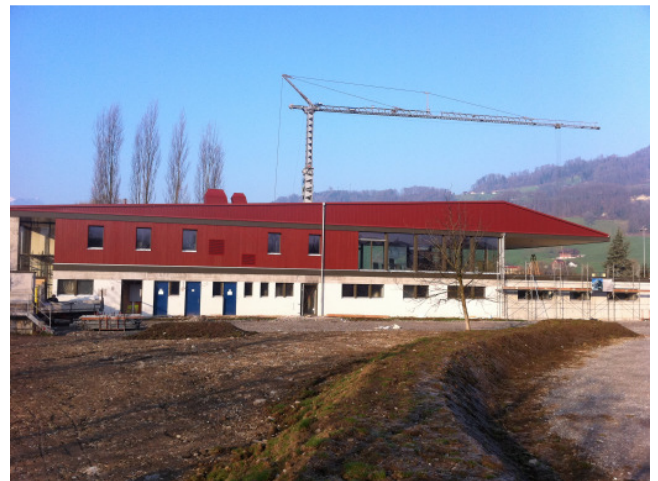
Neues Sporthaus Seefeld