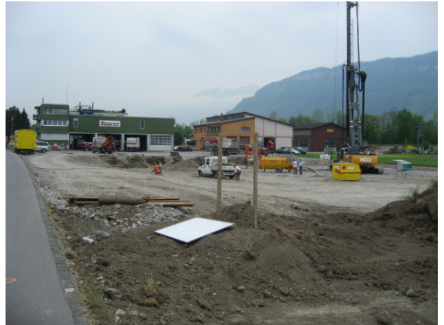
Aushub & solide Pfahlfundation