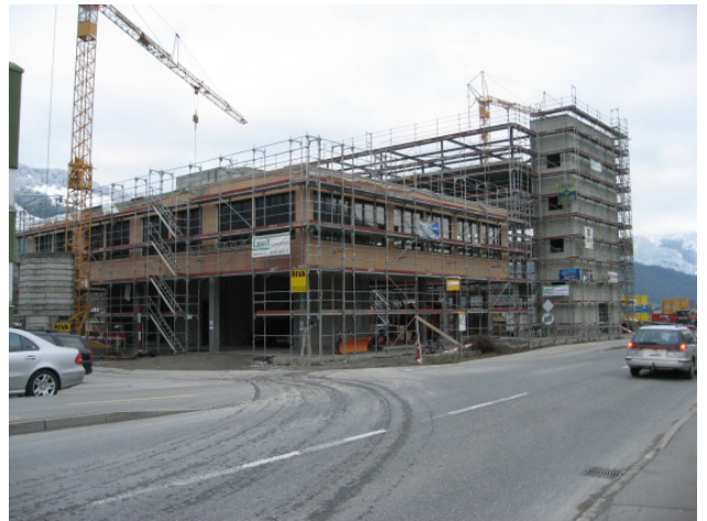
Es geht vorwärts...